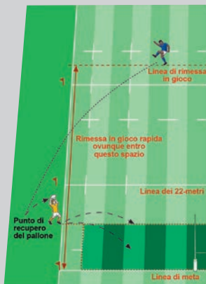
Rimessa in gioco rapida

Se anche questa squadra non effettua correttamente il lancio in touch, verrà formata una mischia sulla linea dei 15 metri. La squadra che aveva effettuato la rimessa per prima introdurrà il pallone in mischia.