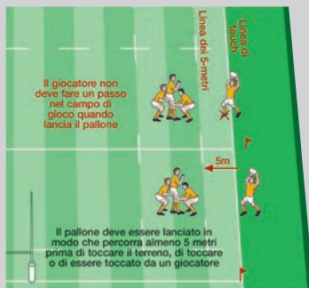
Come si effettua la rimessa in gioco

Il giocatore che lancia il pallone deve farlo dal punto corretto. Il giocatore non deve fare un passo nel campo di gioco quando lancia il pallone. Il pallone deve essere lanciato dritto, in modo che percorra almeno 5 metri lungo la linea di rimessa in gioco prima di toccare il terreno, di toccare o di essere toccato da un giocatore.