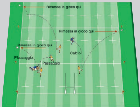
Guadagno di terreno

(h) Calcio in touch non diretto. Quando un giocatore, da un qualsiasi punto dell'area di gioco, calcia indirettamente in touch, in modo che il pallone rimbalzi sul campo di gioco, la rimessa in gioco si effettuerà sul punto in cui il pallone è andato in touch.